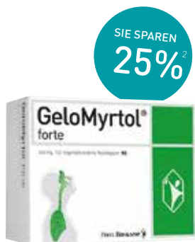
Gelomyrtol forte Kapseln – 100 Stück