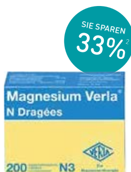
Magnesium Verla N Dragées – 200 Stück